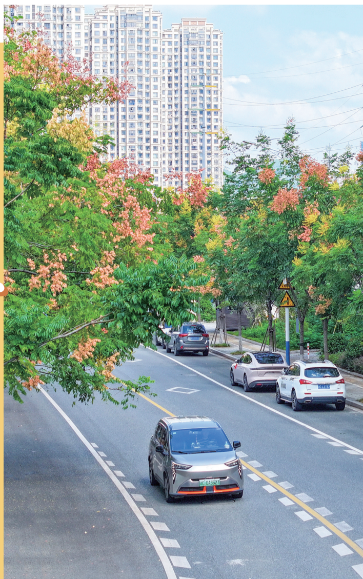
黄山栾树