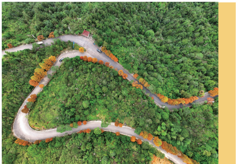
泽雅水杉