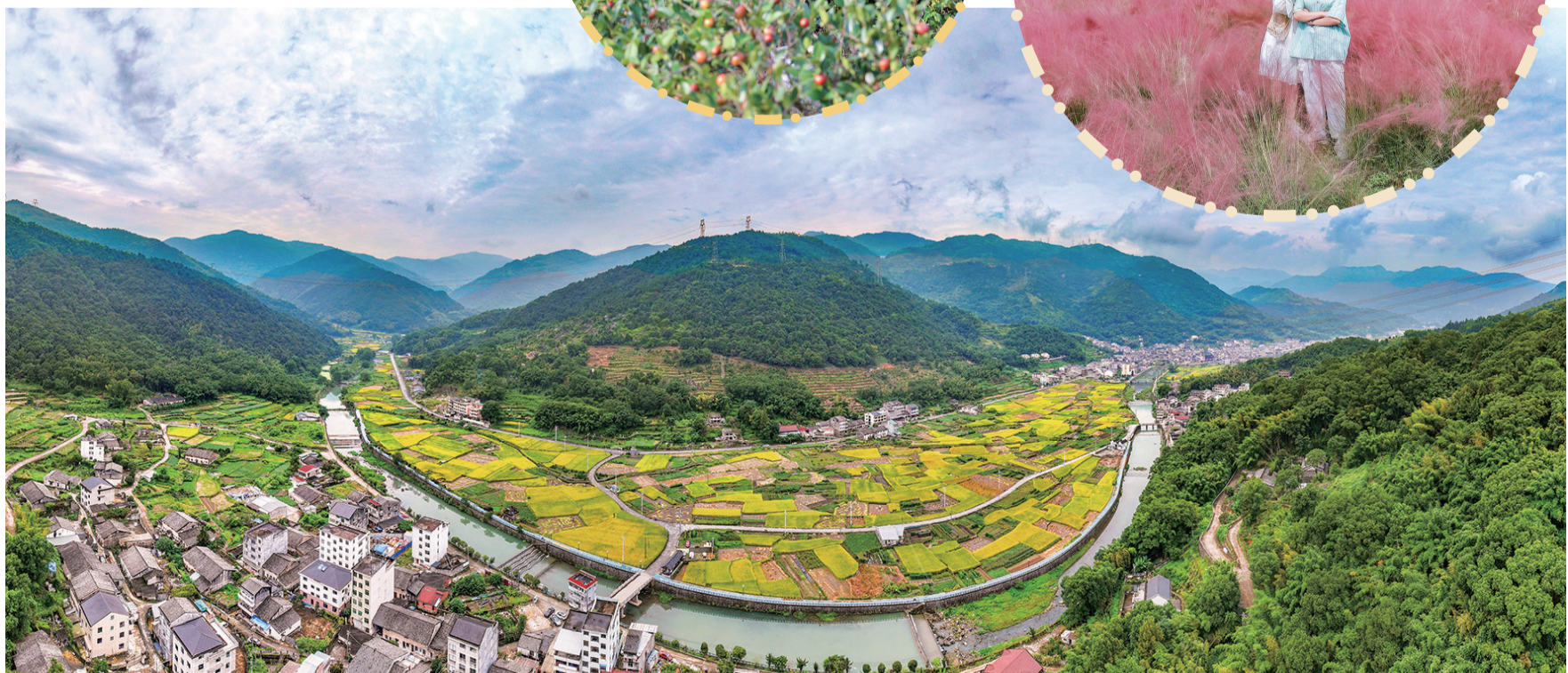
金色“丰”景